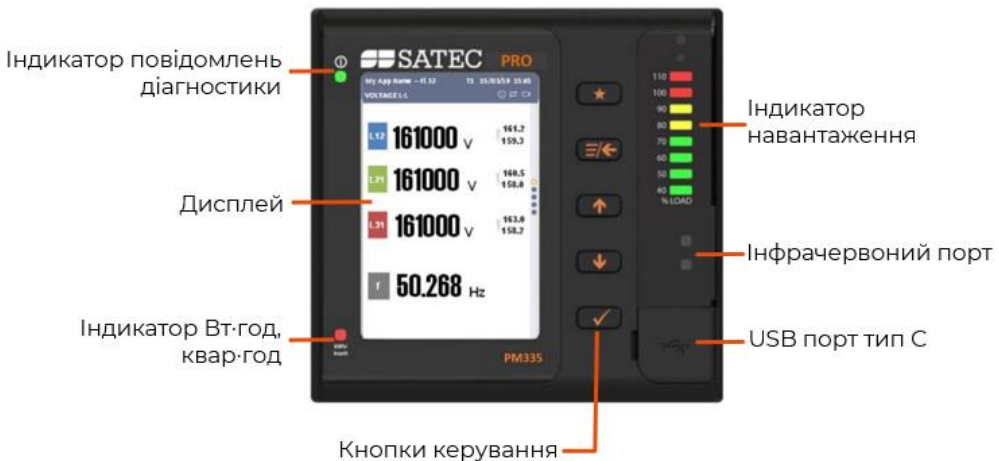
Рисунок 1: Передня панель PM335

УВАГА! Лише кваліфікований електрик може виконувати монтаж і підключення PM335