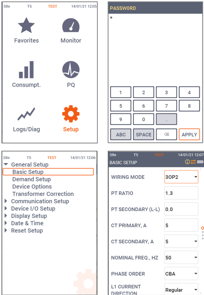
Рисунок 3: Послідовність знімків екрана для базового налаштування

В меню Setup -> Display Setup -> Language мова інтерфейсу вибирається користувачем.